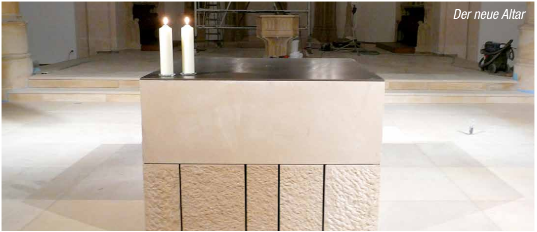
Der neue Altar